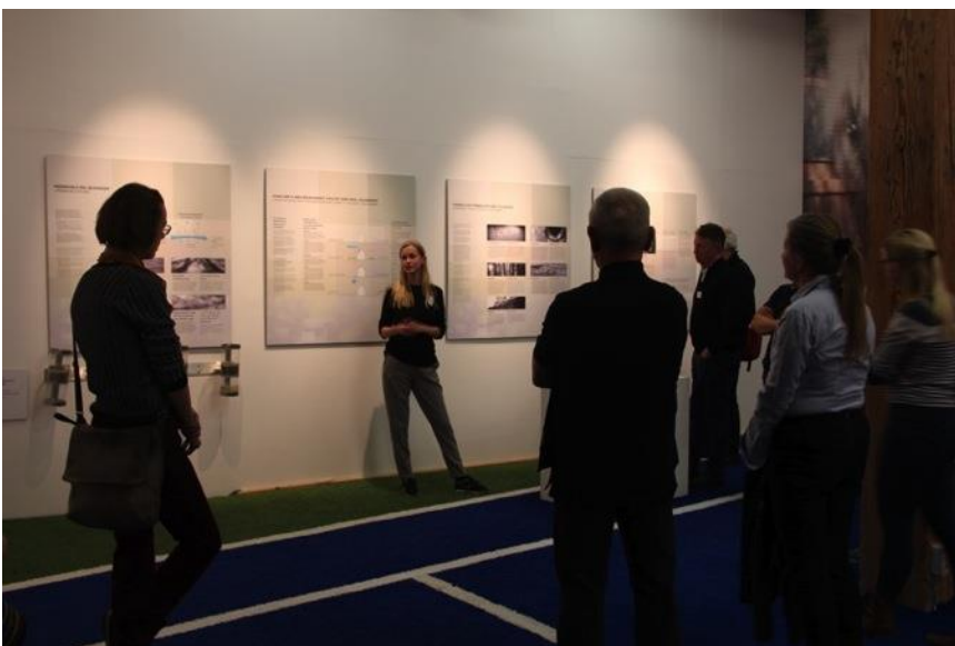
Den blå paddle-tennisbane i udstillingen er et eksempel på den der er ved at blive lavet på Gladsaxe idrætsanlæg, som både kan bruges til at spille på og til opsamling af vand.