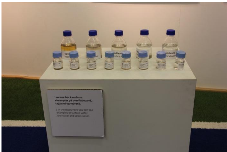
Eksempler på overfladevand, tagvand og vejvand.