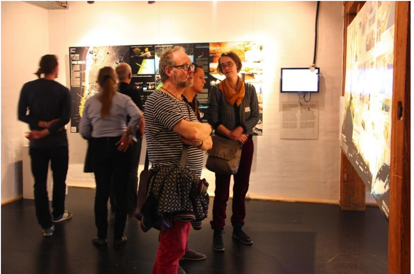
Vi ser også udstillingen 'Rebuild by Design', hvor 10 løsninger til konkurrencen ved samme navn er udstillet. Rebuild by Design konkurrencen blev lavet på baggrund af orkanen Sandy der ramte USA's østkyst i år 2012.