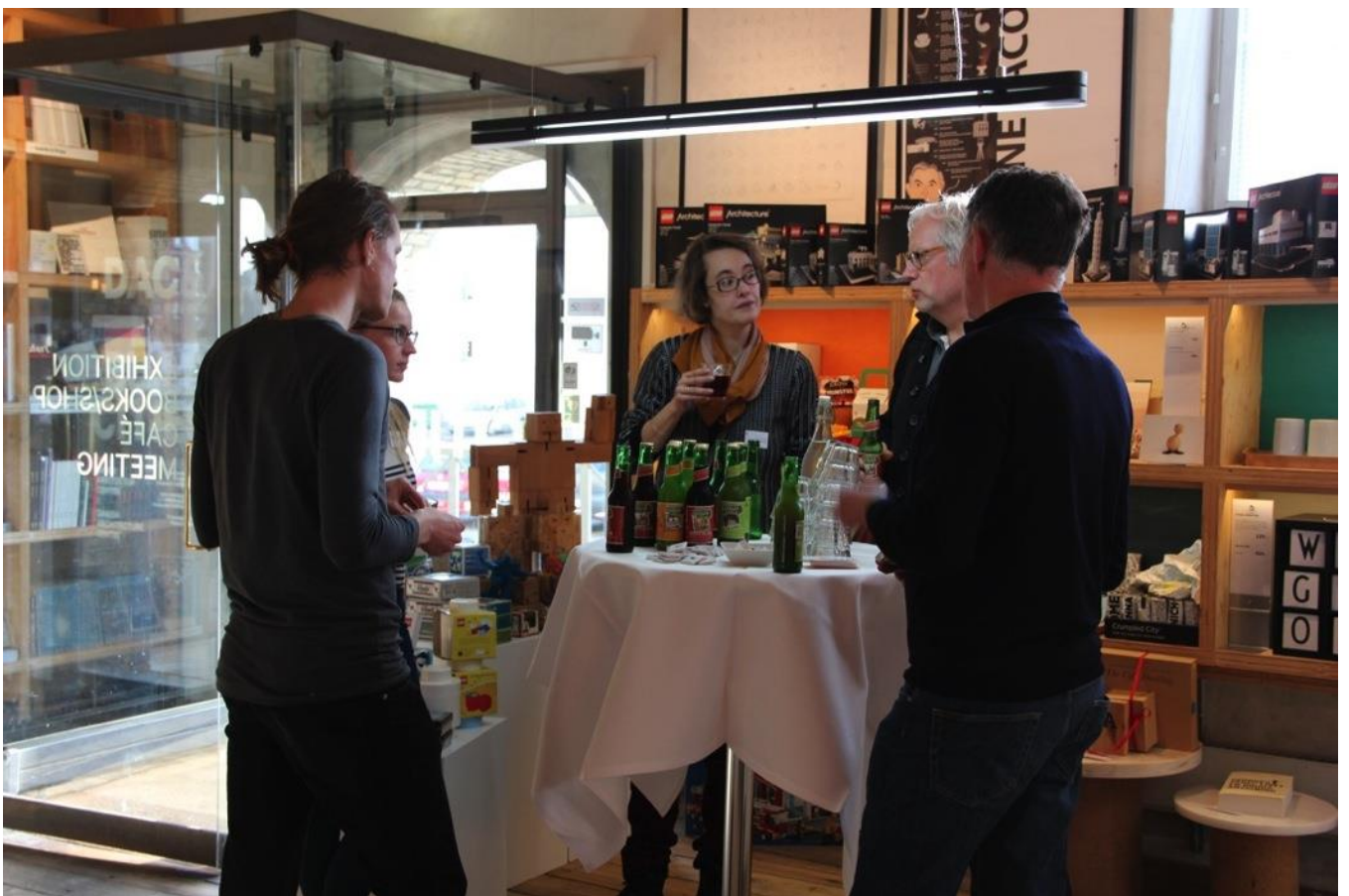
En spændende eftermiddag afrunder vi med hyggelig networking i Dansk Arkitektur Centers boghandel.