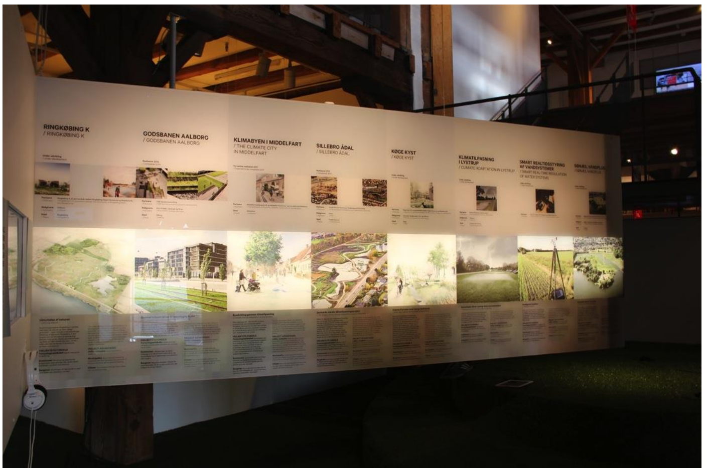
I alt er der udstillet 24 forskellige projekter, som handler om håndtering af vand i både byrum og byområder.