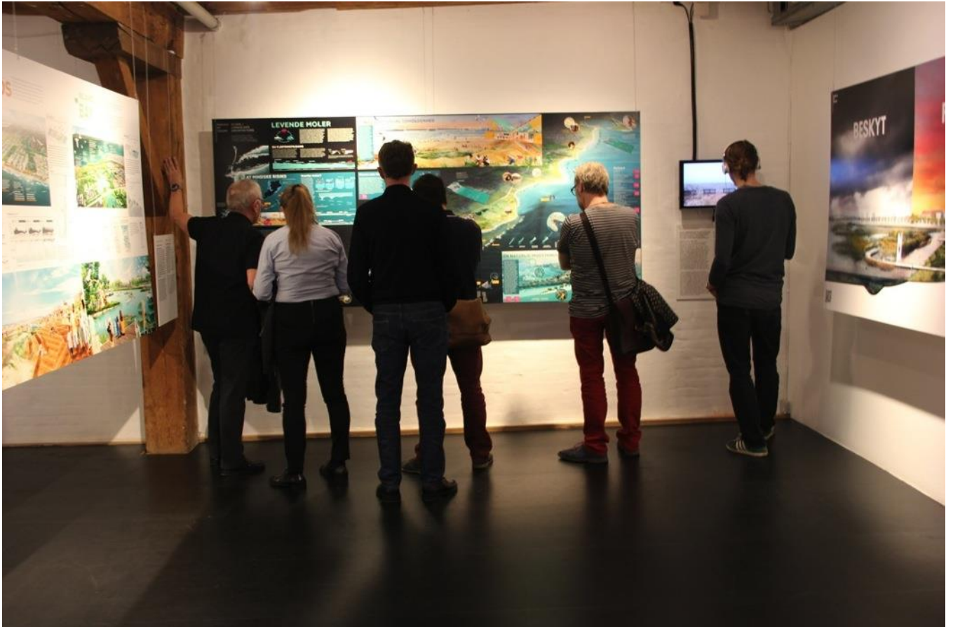
Konkurrencen Rebuild by Design gik ud på, at komme med et bud på hvordan man kunne udbedre skaderne fra orkanen og lave en kystsikring, som gør området mere modstandsdygtigt overfor fremtidige orkaner.