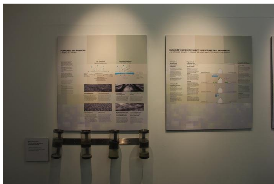
Eksempler på hvordan vand filtreres igennem forskellige permeable overflader.